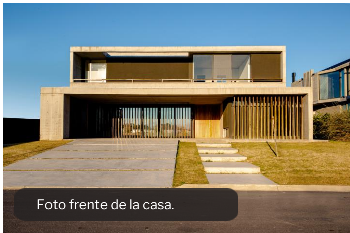
Foto frente de la casa.