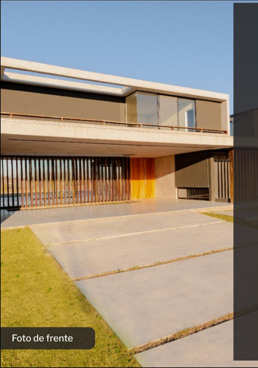
Foto de frente