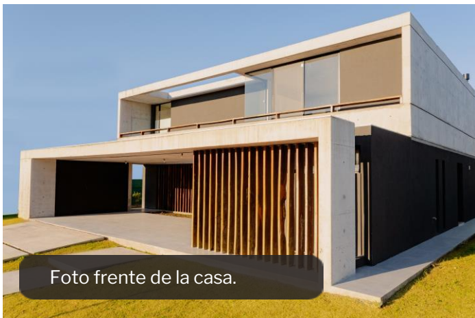
Foto frente de la casa.